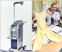
■ (左) 用以抽脂的仪器。(右) 接受抽脂手术后，人们还需每天穿上特制的紧身衣长达一至两个月（洗澡时则除外），以巩固新的身形。